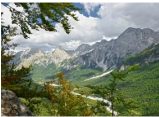
Theth 📍 18km - 🕒 7h Valbona 📍 🚗 Prizren 📍