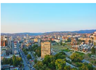
Prizren 📍 🚗 Pristina 📍