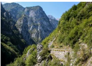
Gorges de Rugova 📍