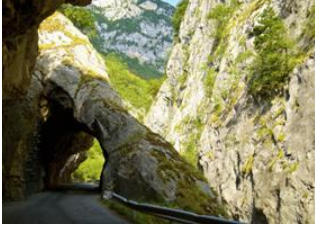
Peja 📍 🚗 Gorges de Rugova 📍